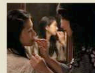
TSUYAKO TSUYAKO 監督: 宮崎光代 2011 | 日本・アメリカ | 25分 | 日本語