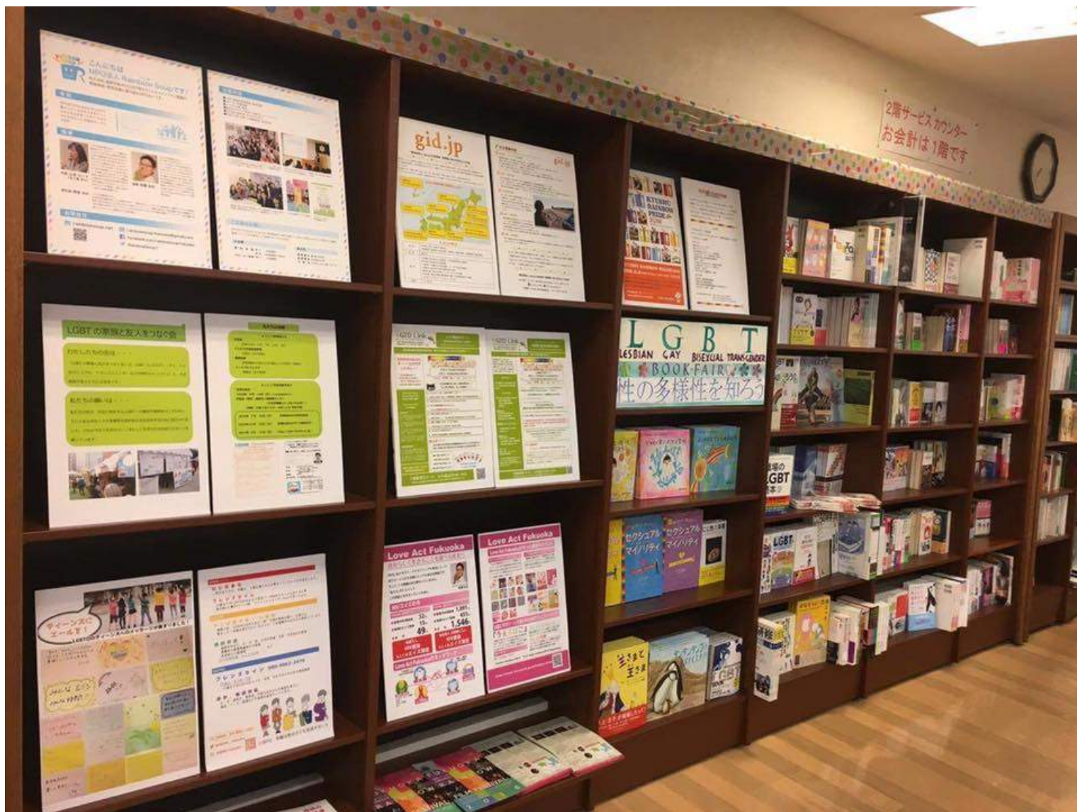
福岡・天神ジュンク堂「LGBTブックフェア」にてフライヤー設置