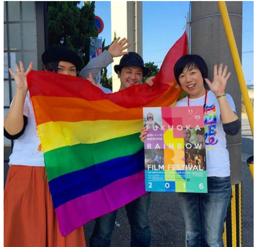
福岡レインボー映画祭当日の様子 http://rainbowsoup.net/rainbow-filmfes-report/