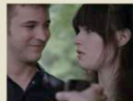
ボーイ・ミーツ・ガール Boy Meets Girl 監督: エリック・シェンファー 2014 | アメリカ | 95分 | 英語

※本映画祭は、2016年5月のGAP×TRPチャリティシャツコンペティションにて寄せられた支援金をもとに実施いたします。応援してくださった全国の皆さま、ありがとうございます!